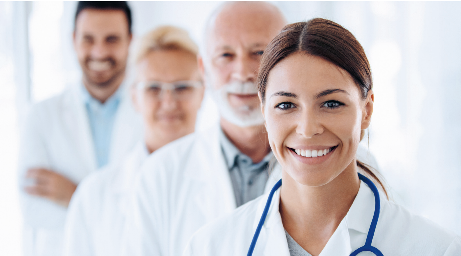
Image actuelle de la profession Médecin spécialiste en médecine interne générale*

La médecine interne générale est l'un des piliers du système de santé, couvrant l'ensemble du spectre de prise en charge ambulatoire et stationnaire: Prévention, médecine d'urgence et soins aigus, maladies chroniques réhabilitation et soins palliatifs.